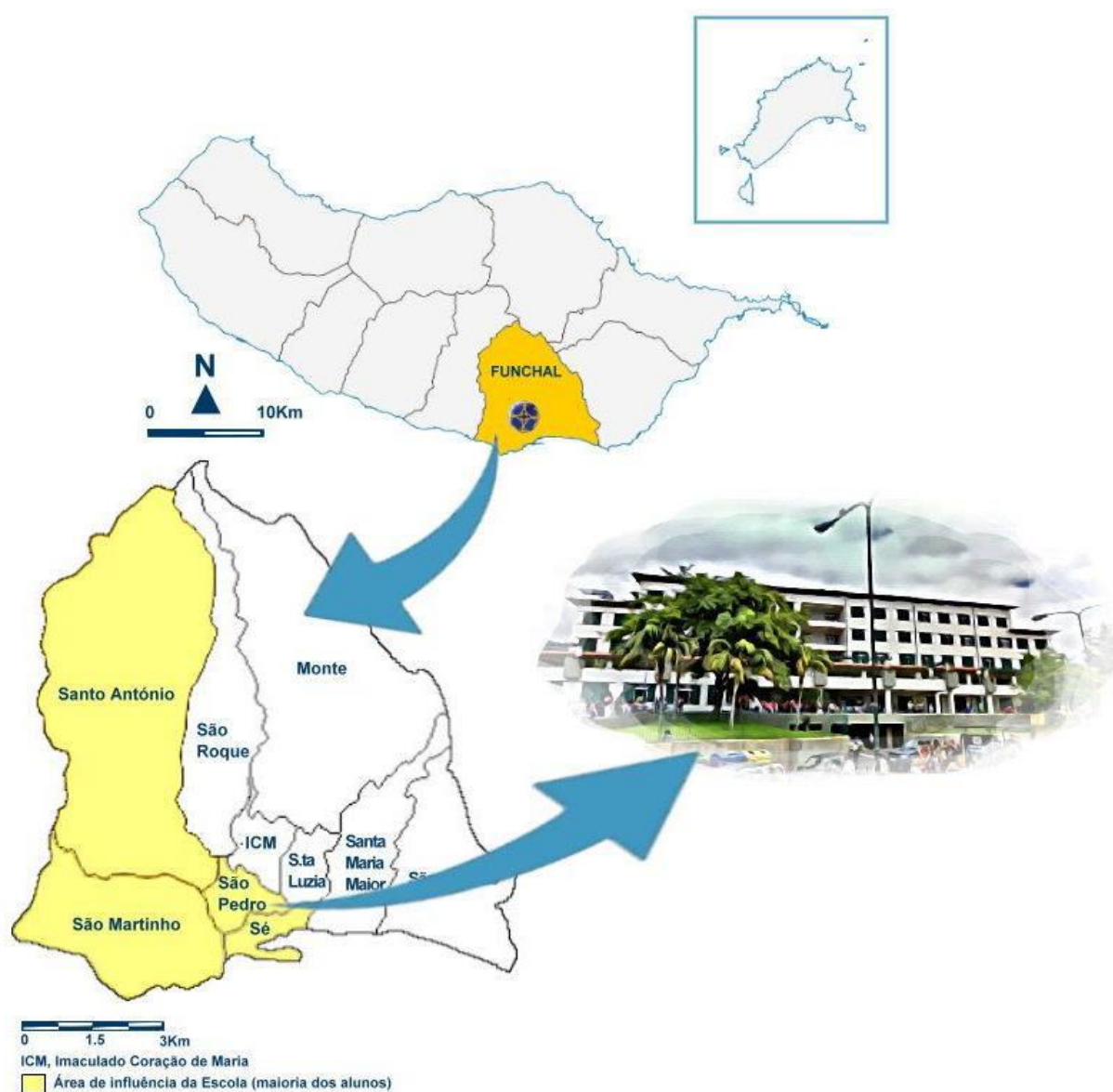
Fig. 1 – Região Autónoma da Madeira, Concelhos e freguesias do Concelho do Funchal: localização da HBG.

Situada na parte Oeste da cidade do Funchal (Estrada da Liberdade, n.º1), a HBG acolhe uma população socialmente diversificada e oriunda do Concelho do mesmo nome, predominantemente, das freguesias de S. Pedro, Santo António, S. Martinho e Sé.